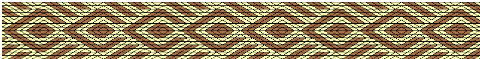
Схема заправки дощечек: